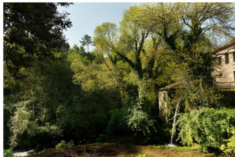
El río Sar arrullando A Quinta da Auga