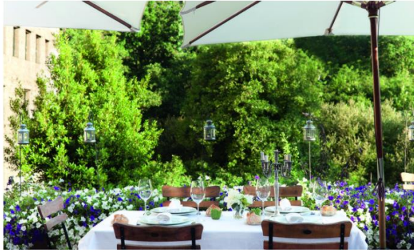
A Quinta da Auga (Santiago de Compostela)

Con 51 habitaciones , todas ellas decoradas de manera diferente, ocupa una quinta de 10.000 m2 a orillas del rio Sar , y cuenta con un spa de cinco estrellas y restaurantes que sirven platos elaborados con el mejor producto de la tierra.