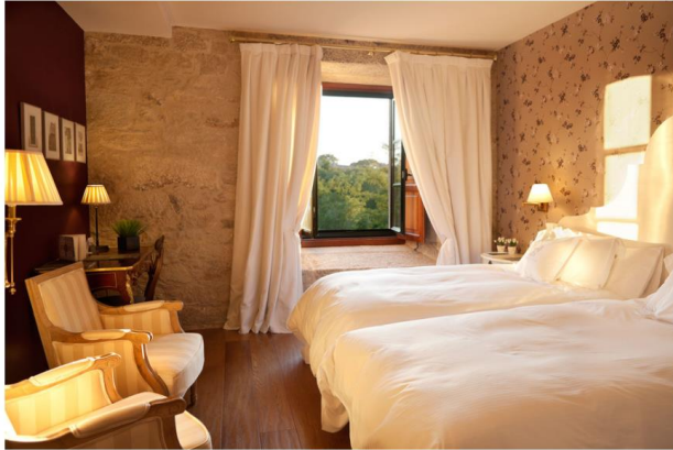
A Quinta da Auga, Santiago de Compostela