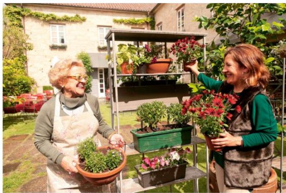
Las dueñas de Quinta da Auga disfrutan con su trabajo... y se nota.

Apostaron por el uso de las nuevas tecnologías para crear un espacio sensible con su entorno y que aprovechase al máximo todos los recursos.