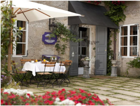
El desayuno servido en la terraza de A Quinta da Auga