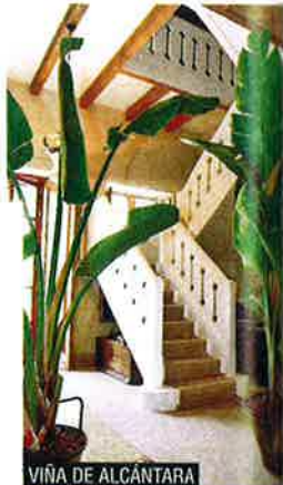
VIÑA DE ALCÁNTARA