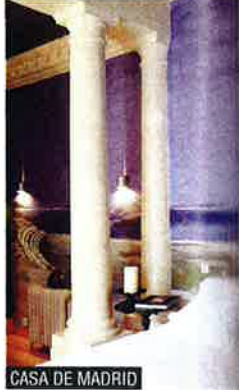
CASA DE MADRID

❁ Olvídate de que lo ecológico está reñido con el lujo: DESIGN HOTELS tiene cuatro en cartera que no agredirán tu mentalidad verde. Se llaman: Nordic Light Hotel (Estocolmo), Vigilius Mountain Resort (sur del Tiro), Alila Villas Uluwatu (Bali) y Alila Villas Hadahaa (Maldivas). ( www.designhotels.com ).