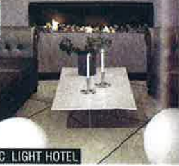
NORDIC LIGHT HOTEL