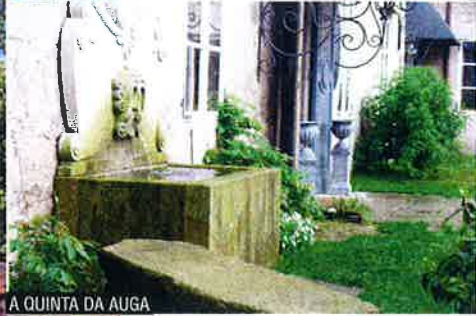
A QUINTA DA AUGA