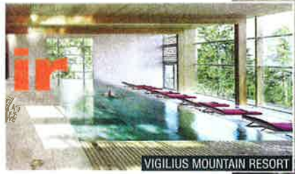
VIGILIUS MOUNTAIN RESORT