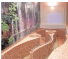
Garantía Certificado de Calidad Turística «Q»

Sus cuidadas instalaciones, rodeadas de jardines y zonas deportivas, confieren al hotel balneario Cervantes la apariencia de un oasis dentro de la árida llanura manchega, en un contraste de colores ocres de la tierra, verdes de sus árboles y azul de las aguas de sus numerosas fuentes. Y para color diferente, el que proporcionan los sorprendentes atardeceres.