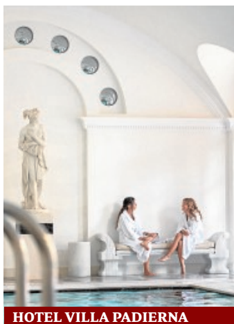
HOTEL VILLA PADIERNA