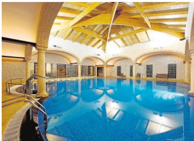
Una imagen de la piscina del balneario Cervantes

El hotel de cuatro estrellas dispone de 104 acogedoras habitaciones, la mitad de ellas con espaciosos salones. La oferta del restaurante permite degustar una interesante variedad