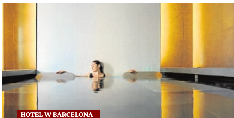
HOTEL W BARCELONA

terior climatizada con vistas al jardín y cabinas con luz natural. Cuenta también con peluquería y gimnasio con especialistas en pilates.