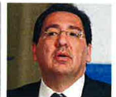
Antonio Pulido, EFE

¿De regreso? Las últimas maniobras de Bañuelos formarían parte de un plan para volver al mercado español. NEGOCIO